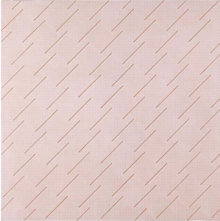
Sense títol , 1997. Acrílic sobre llenç