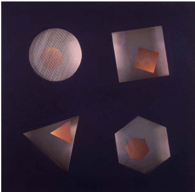
Relleu lluminós , 1955. Tècnica mixta (fusta, plàstic, tremp, llums incandescents i dos interruptors elèctrics)

A l'any 56 Sempere fa un pas més amb la superposició de línies a l'interior de les seues figures geomètriques, creant diferents plans visuals.