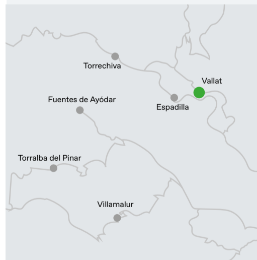
1 Tres arbres i tretze fruites Calle Extramurs, 10