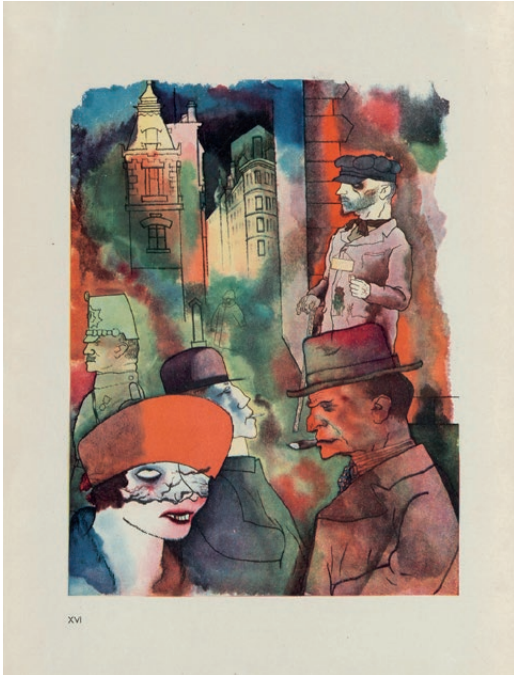
George Grosz, Crepúsculo , de la carpeta Ecce Hommo , 1922. IVAM Institut Valencià d'Art Modern, Generalitat

Així, si ens trobem dins d'un espai i un sistema de l'art determinats i a l'espera de la seua anhelada revolució, no hi ha res millor que entendre el museu com l'entorn adequat per a desenvolupar un nou moviment cultural. Un capaç de prolongar les línies d'experimentació i de reflexió que alguna vegada van ser cridades a l'orde.