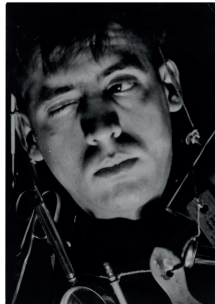
Käte Steinitz, The Designer , ca. 1920. IVAM Institut Valencià d'Art Modern, Generalitat

No obstant això, amb l'aparició de les obres d'art i artistes sempre ocorre una certa discriminació, una espècie de sedàs en què no ens queda molt més que aferrar-nos a eixe pensament segons el qual una obra només és considerada art si la societat diu que ho és. Una idea sobre una certa estètica de la col·lectivitat que reconstrueix, ens agrada o no, allò possible de la nostra època i potencia l'oblidada implicació d'un públic que ara manipula i interpreta les obres i les fa reviure cada vegada des d'una perspectiva original.