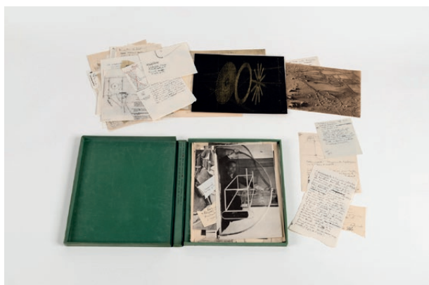
Marcel Duchamp, La mariée mise a nu par ses célibataires même - Boîte verte , ca. 1934. IVAM Institut Valencià d'Art Modern, Generalitat

Encara que ens parega nova, és una història no gens original. Som la mostra viva que ens trobem en una trama social i global configurada a base de pedaços. Una situació en la qual les obres ens indiquen que una cosa diferent està per vindre i que hem de decidir com afrontar-la. La decisió que prenguem serà contemporània o no serà, no pot pertànyer al passat ni al futur, només al present.