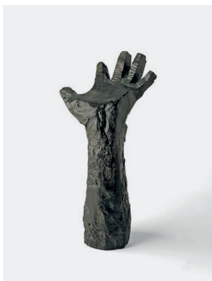
Julio González, Main gauche levée n°2 , 1942. IVAM Institut Valencià d'Art Modern, Generalitat