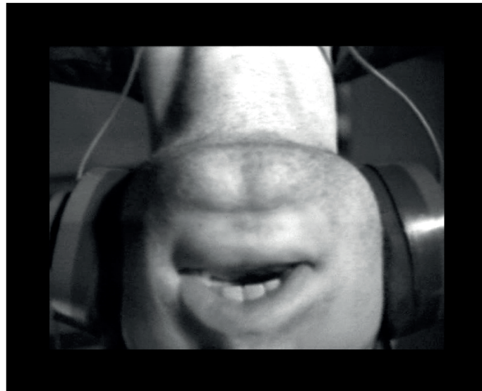
Bruce Nauman, Lip Sync , 1969. IVAM Institut Valencià d'Art Modern, Generalitat

Dossier de premsa IVAM Centre Julio González