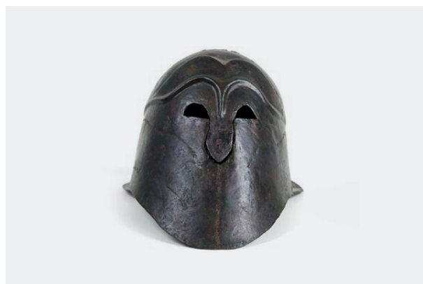
Anònim, Casco corinti amb gravats de senglars , s. d. IVAM Institut Valencià d'Art Modern, Generalitat