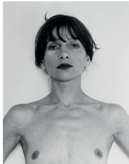
Humberto Rivas, La Polaca , 1981. IVAM Institut Valencià d'Art Modern, Generalitat

Una col·lecció, com la que ací analitzem, és una construcció històrica i social que permet rastrejar una multiplicitat de codis, ideologies, modes i condicions. És un artefacte que llança llum sobre una època que, així mateix, necessita ser mirada transversalment. La seua potència radica en el fet que té la capacitat de mesurar un temps de presència i d'absències. Per a la qual cosa és necessari observar-la des d'un cert compromís social.