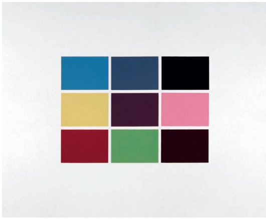
Gerhard Richter, Farbtafeln , 1971. IVAM Institut Valencià d'Art Modern, Generalitat