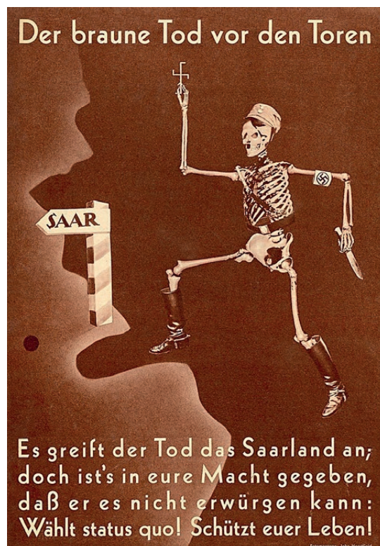
John Heartfield, AIZ núm. 2, Der braune Tod vor den Toren , pág. 32, 1935. IVAM Institut Valencià d'Art Modern, Generalitat. Colecció Marco Pinkus

La vida, com ara el museu, se'ns presenta com una cosa a reconstruir a partir d'uns fragments que ens són familiars i alhora estranys; als quals hem de prescriure noves funcions i arguments abans que definitivament hàgem esgotat per complet totes les possibilitats. Potser és el resum de la trobada que tenim diàriament amb l'art: una situació que simplement consisteix a plantar-nos cara a cara davant d'una foscor particular.