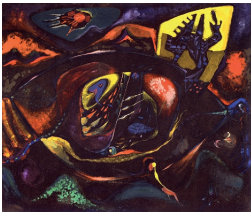
André Masson, Un grain de mil , 1942. IVAM Institut Valencià d'Art Modern, Generalitat

Així, si ens trobem dins d'un espai i un sistema de l'art determinats i a l'espera de la seua anhelada revolució, no hi ha res millor que entendre el museu com l'entorn adequat per a desenvolupar un nou moviment cultural. Un capaç de prolongar les línies d'experimentació i de reflexió que alguna vegada van ser cridades a l'orde.