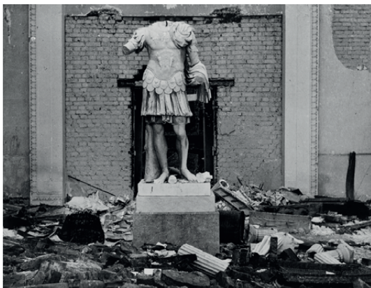
Herbert List, Roman Statue in the Glyptothek, Munich , 1945. IVAM Institut Valencià d'Art Modern, Generalitat

La possibilitat de connectar amb altres coses requereix una altra mena d'alfabetització, de preparació davant dels objectes. Chris Kraus, en el llibre Video Green , ens adverteix que sovint és «l'objecte el que simplement funciona com un disparador de la col·lecció real , la qual és completament interna». És una fantasia en què se'ns convida a participar i que conté la creença en la primacia i el misteri de l'objecte; una escena que vol escapar-se d'eixe temut significat real de l'obra per a tornar al que una vegada va ser una actitud o fins i tot un gest. Una posició que se'ns presenta una mica esquiva, però que s'estira, es corba i es mostra descarada en un segle XXI en el qual tothom pensa que ja no tenim res més a perdre.