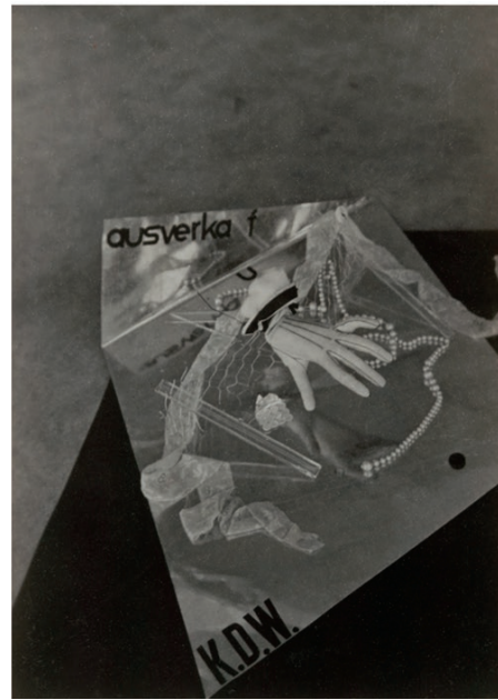
Hannes Meyer, Composition with Pearls , ca. 1929. IVAM Institut Valencià d'Art Modern, Generalitat

La possibilitat de connectar amb altres coses requereix una altra mena d'alfabetització, de preparació davant dels objectes. Chris Kraus, en el llibre Video Green , ens adverteix que sovint és «l'objecte el que simplement funciona com un disparador de la col·lecció real , la qual és completament interna». És una fantasia en què se'ns convida a participar i que conté la creença en la primacia i el misteri de l'objecte; una escena que vol escapar-se d'eixe temut significat real de l'obra per a tornar al que una vegada va ser una actitud o fins i tot un gest. Una posició que se'ns presenta una mica esquiva, però que s'estira, es corba i es mostra descarada en un segle XXI en el qual tothom pensa que ja no tenim res més a perdre.