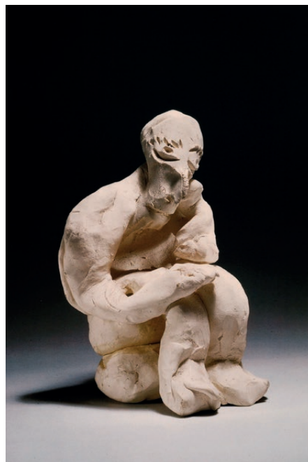
Pablo Picasso, Vieillard assis , 1952. IVAM Institut Valencià d'Art Modern, Generalitat