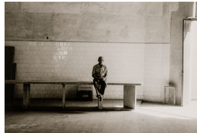
Gabriel Cualladó. La Albufera , València, 1985 Fotografía a las sales de plata sobre papel, copia de época 18.3 x 27.2 cm. IVAM Institut Valencià d'Art Modern, Generalitat. Donación del artista