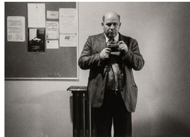
Gabriel Cualladó. Real Sociedad Fotográfica , Madrid, ca. 1979-1982 Fotografía a las sales de plata sobre papel. Copia moderna anterior a 1989 17,5 x 24,3 cm IVAM Institut Valencià d'Art Modern, Generalitat. Donación del artista

En 1961 Cualladó recibe el trofeo 'Luis Navarro' de fotografía de La Vanguardia. Este período marca el inicio de la difusión de su obra fuera de España. A lo largo de esta década sus obras se exhiben en las principales ciudades europeas: la Bienal de Pescara en Italia, la biblioteca de la Embajada de España en París, el Museo Fodor en Ámsterdam o la exposición Interpress-Photo en Moscú. La foto de Cualladó Niña de la rosa , junto con otras obras, se incorpora a la colección de la Biblioteca Nacional Francesa y sus