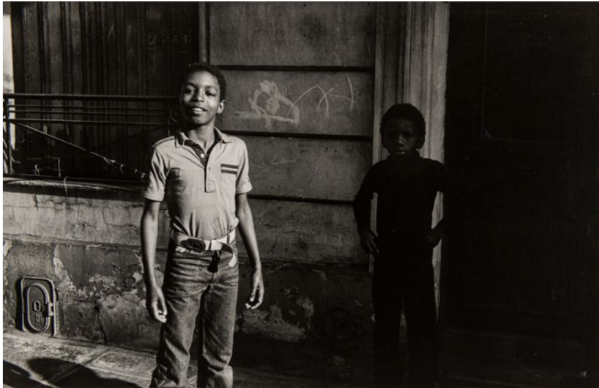
Gabriel Cualladó. Niños jugando , París, 1982 Fotografía a las sales de plata sobre papel, copia de 1982 17,3 x 26,8 cm IVAM Institut Valencià d'Art Modern, Generalitat. Donación del artista