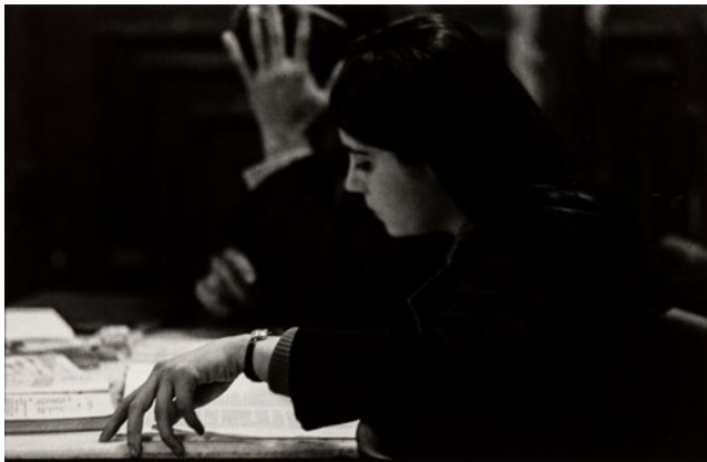
Gabriel Cualladó. Cervecería Alemana , Madrid, 1960 Fotografía a las sales de plata sobre papel. Copia moderna anterior a 1989 17,2 x 26,6 cm IVAM Institut Valencià d'Art Modern, Generalitat. Donación del artista