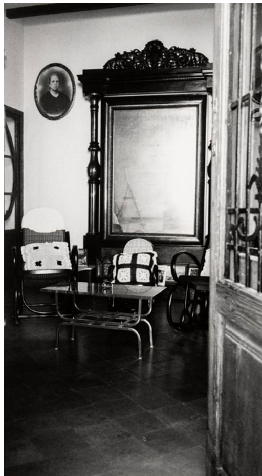
Gabriel Cualladó. Interior de casa de Oliva , de la serie Gandia i la Safor , 1990 Fotografía a las sales de plata sobre papel, copia de época 29,4 x 16,5 cm IVAM Institut Valencià d'Art Modern, Generalitat Donación del artista

Fallece en 2003, dejando un legado duradero, contando la historia de una Europa de posguerra tan fragmentada como conmovedora. A lo largo de la década de 2000 se realizaron diversas exposiciones de su obra, como la que le dedicó el IVAM en el año 2003.