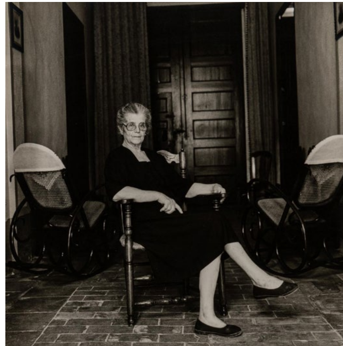
Gabriel Cualladó Serie L'Albufera. Visió Tangencial , II Jornades Fotogràfiques, València, 1985 Sin título Fotografies a las sales de plata sobre papel, copias de época IVAM Institut Valencià d'Art Modern, Generalitat