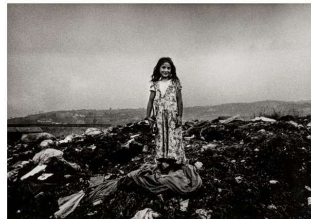
Gabriel Cualladó. Gitanilla . Sama de Langreo, Asturias, 1978 Fotografía a las sales de plata sobre papel, copia de época 41.2 x 60.8 cm. IVAM Institut Valencià d'Art Modern, Generalitat. Depósito Colección Gabriel Cualladó

La primera planta del museo reúne tres de las series sobre las que Cualladó estuvo trabajando durante años: Real Sociedad Fotográfica , Cervecería Alemana y París . Las fotografías seleccionadas de la serie Real Sociedad Fotográfica (ca. 1979-1982) son las copias realizadas por Cualladó hacia la segunda mitad de los años ochenta, a diferencia de las positivadas en 1982 para su exposición individual con motivo de la Primavera de la Fotografía en Barcelona, en el Centro Internacional de Fotografía y en Spectrum Canon. El conjunto elegido para esta exposición muestra algunas de sus fotografías más abstractas, que incluyen juegos de simetrías y elementos referenciales y metalingüísticos, como la imagen del póster de una fotografía de Dorothea