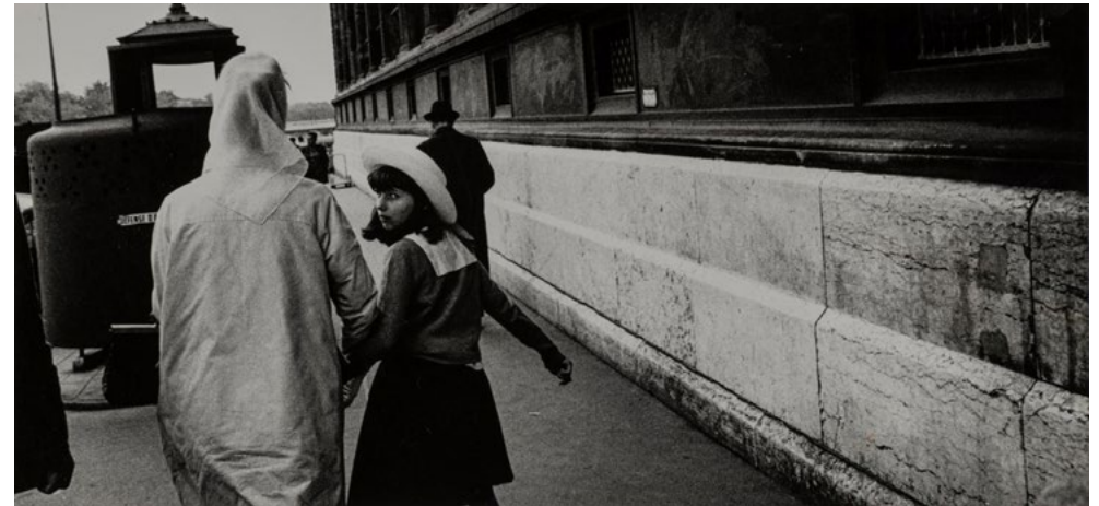
Gabriel Cualladó. París , 1962 Fotografía a las sales de plata sobre papel, copia de 1982 13,9 x 29,8 cm IVAM Institut Valencià d'Art Modern, Generalitat Donación del artista