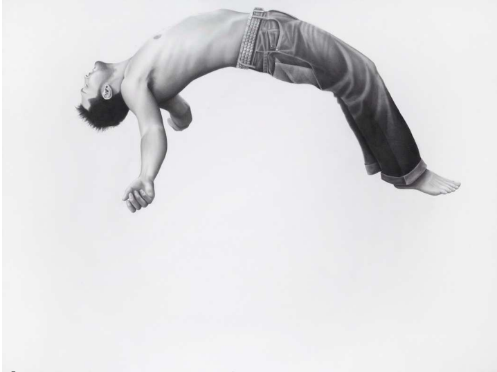
Éxtasis , Jacinto de Manuel

Éxtasis forma parte de una serie de obras que tienen como tema los atributos de la mística y lo onírico. Jacinto de Manuel utiliza en estas obras una técnica mixta en la que predomina casi por completo el dibujo. Esta técnica permite al autor crear una imagen directa, sencilla y reducir la escena de elementos compositivos hasta llegar a un ejercicio de figura y fondo. La figura humana y los objetos con constantes en la obra de este autor, enmarcados en la escena sin una referencia espacial, flotando en el vacío.