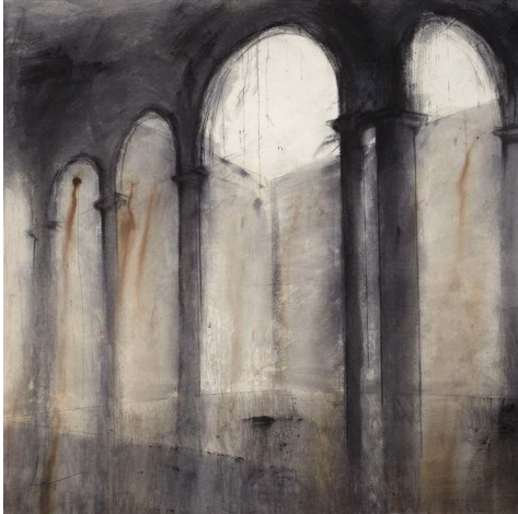
Obertura I , Marc Prat Codina

La obra Obertura I forma parte de una serie de pinturas en las que la figuración y la arquitectura dan paso a un diálogo entre la luz y el espacio, donde la materia y el ambiente se entrelazan. Con esta obra, el autor pretende trasladar al espectador la idea de la búsqueda constante de la realidad.