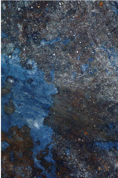
Constelación 1: Paseo de la Castellana esquina Ayala, Elena Garrigues

La obra de Elena Garrigues tiene como argumento central el suelo, entendido como elemento que sostiene y guía. La autora pretende reivindicar el valor del suelo y alejar al espectador de la actitud utilitaria con que se relaciona con este elemento. Esta obra está literalmente tomada en el cruce de calles de Madrid que se describe en el título. Mediante una plancha de metal encontrada en una obra de Madrid se juega con el espectador haciéndole ver que el cielo y las constelaciones también pueden verse en el propio suelo.