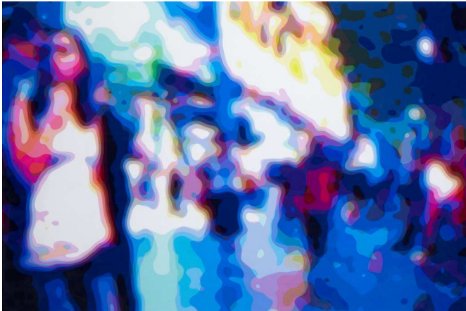
P 1740 , Juan Zurita

El hilo conductor de esta obra es el espacio urbano y la atmósfera eléctrica de la metrópolis. El autor plasma escenarios en los que la gente y el contexto en el que se encuentran se mezclan junto con la predilección por la luz y el color. En concreto, P 1740 es un fotograma tratado digitalmente, extraído de un video grabado en París. La figura de los personajes se desvanece y se fusiona hasta ser absorbida por el entorno que le rodea.