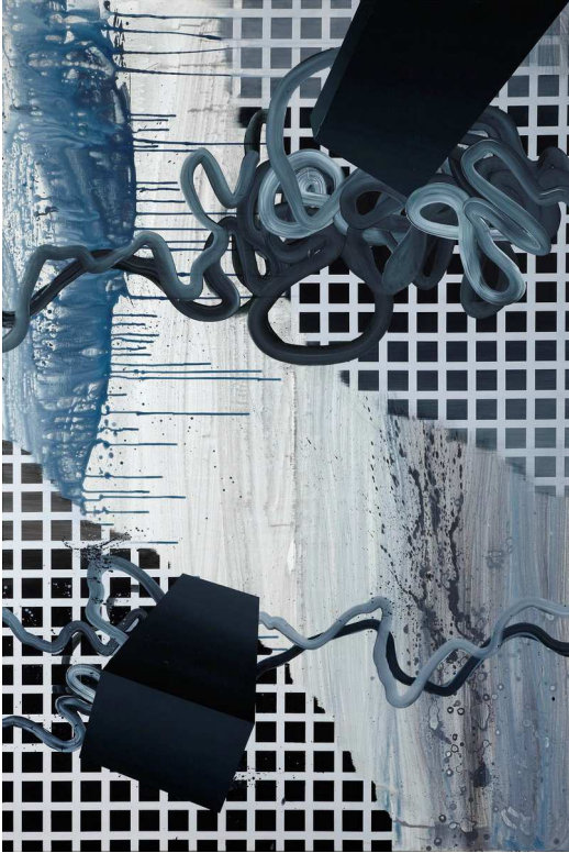
Amanecer del hombre , Joan Cabrer

Joan Cabrer utiliza la pintura como herramienta, con todos sus recursos, y haciendo hincapié en el color y la forma. El artista busca con esta obra reflejar en el lienzo un mundo inaccesible a los ojos del hombre con el que quiere reclamar el espacio tradicional de la pintura en el ámbito del arte, desplazado en su opinión en los últimos años por otras tendencias más inmediatas. Cabrer propone aplicar esos nuevos recursos, materiales y tecnología a la pintura.