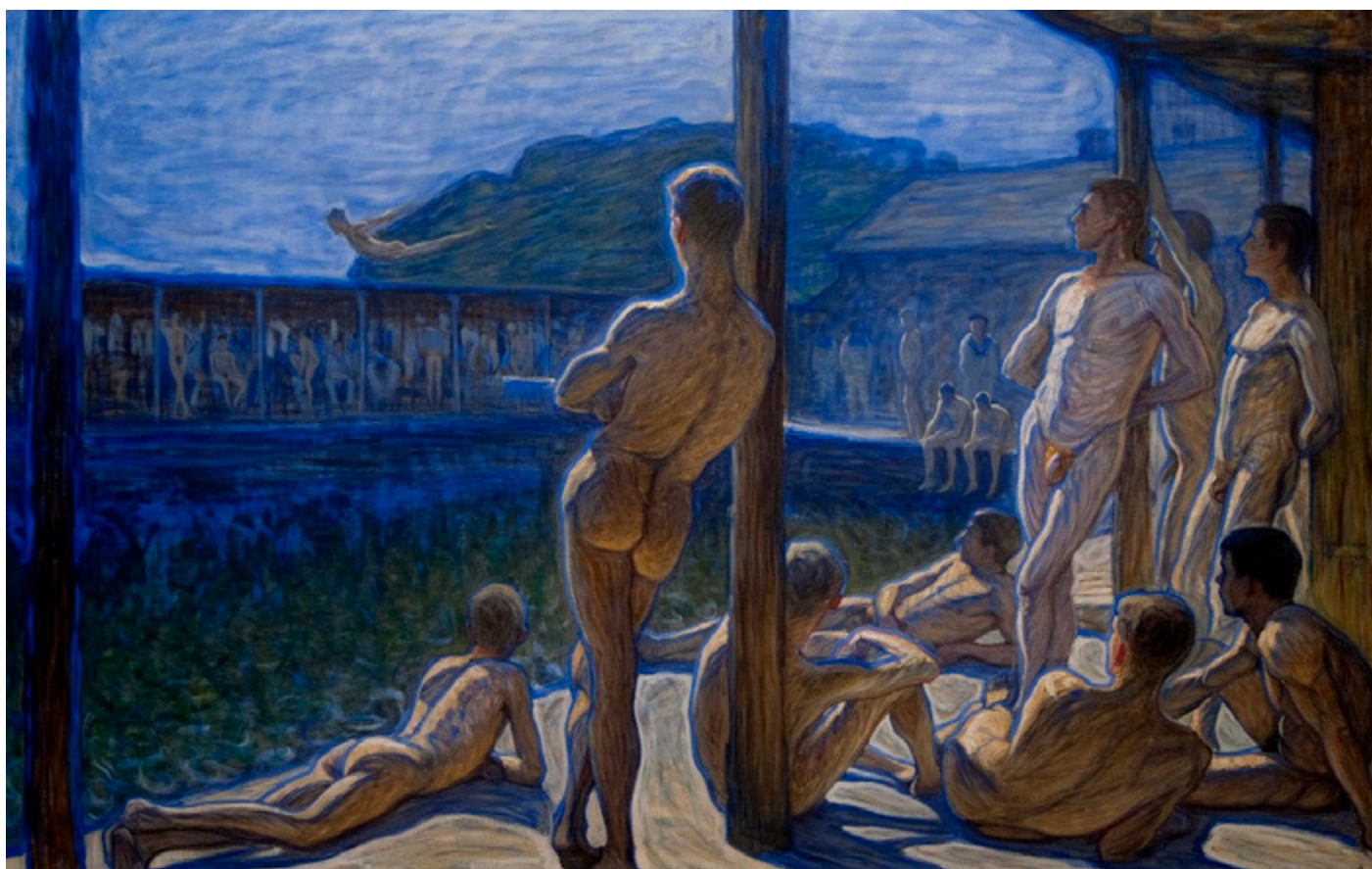
Casa de banys , ca. 1907 Eugène Fredrik Jansson. Oli sobre tela.