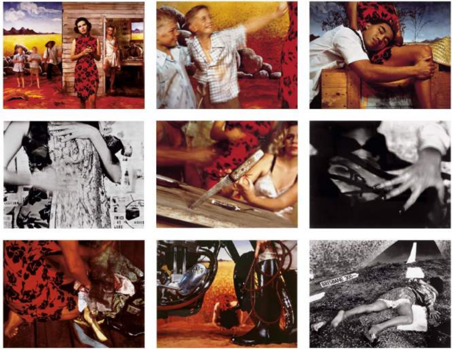
Something More, 1989, Tracey Moffatt. Fundación Helga de Alvear

L'IVAM presenta la doble exposició 1989. La fi del segle XX i Cas d'estudi: 1989. IVAM que té com a objectiu posar en context el naixement de l'IVAM el 18 de febrer de 1989 amb aqueix any, que ha sigut considerat tan fonamental: la primera, a través d'obres d'art d'artistes nacionals i internacionals produïdes en 1989 i vinculades a alguns dels esdeveniments més importants que van succeir en aqueixa data històrica, i la segona, a través de la investigació que ha desenvolupat el Centre d'Investigacions Col·laboratives (C.I.C.) sobre el procés de formació del propi IVAM.