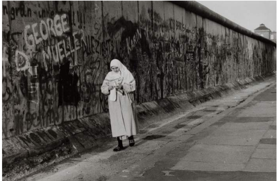
Berlin, 1989. Sibylle Bergemanner. Courtesy Look Galerie, Berlin © Estate Sibylle Bergemann; Ostkreuz

què va acabar una època, la que va quedar definida per la Guerra Freda que va seguir a la II Guerra Mundial, per l'enfrontament entre l'Est i l'Oest, entre les democràcies europees i nord-americanes i les dictadures soviètiques i les seues conseqüències bèl·liques, geogràfiques, polítiques i socials. Una fi que va quedar reflectit en una imatge: la de la caiguda del mur que separava Berlín el 9 de novembre, un mur que valia per un altre, el del Teló d'acer.