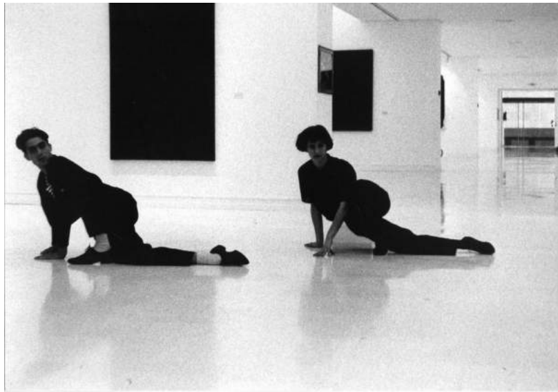
Performance con motivo de la exposición Pierre Soulages , IVAM, 1989