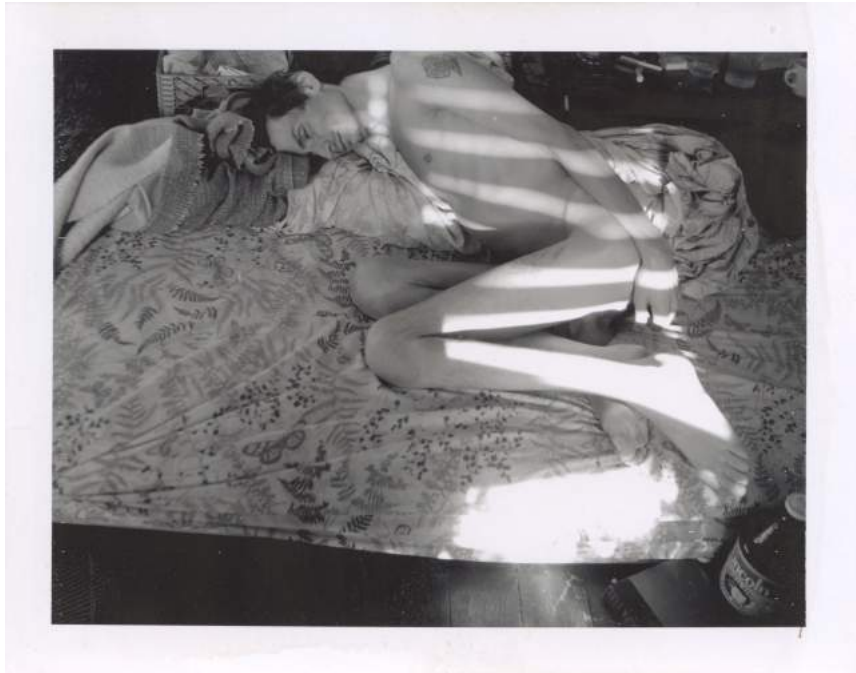
Untitled, Self-Portrait, 1989. Mark Morrisroe.. Nachlass Mark Morrisroe Sammlung Ringier im Fotomuseum Winterthur

En ese año se produjeron algunos casos de censura muy relevantes en Estados Unidos, como el cierre de la exposición de Robert Mapplethorpe en la Corcoran