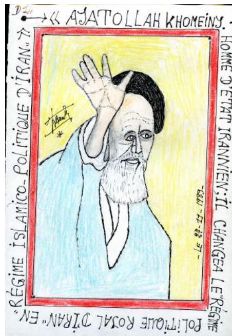
Ayatollah Khomeiny homme d'État iranien; il changea le régime politique royal d'Iran en régime islamico-politique d'Iran Bouabré, 1989. Frédéric Bruly Bouabré. CAAC – The Pigozzi Collection Geneva

1989 ha sido considerado como el año en el que terminó una época, la que quedó definida por la Guerra Fría que siguió a la II Guerra Mundial, por el enfrentamiento entre el Este y el Oeste, entre las democracias europeas y norteamericanas y las dictaduras soviéticas y sus consecuencias bélicas, geográficas, políticas y sociales. Un fin que quedó reflejado en una imagen: la de la caída del muro que separaba Berlín el 9 de noviembre, un muro que valía por otro, el del Telón de acero.