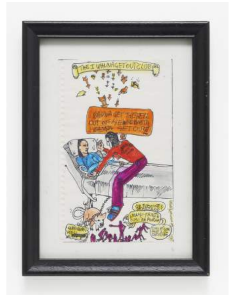
Untitled , 1989. Vittorio Scarpati.

1989 va ser també l'any en què es va inaugurar l'IVAM. L'exposició 1989. IVAM, dins de la línia d'exposicions Cas