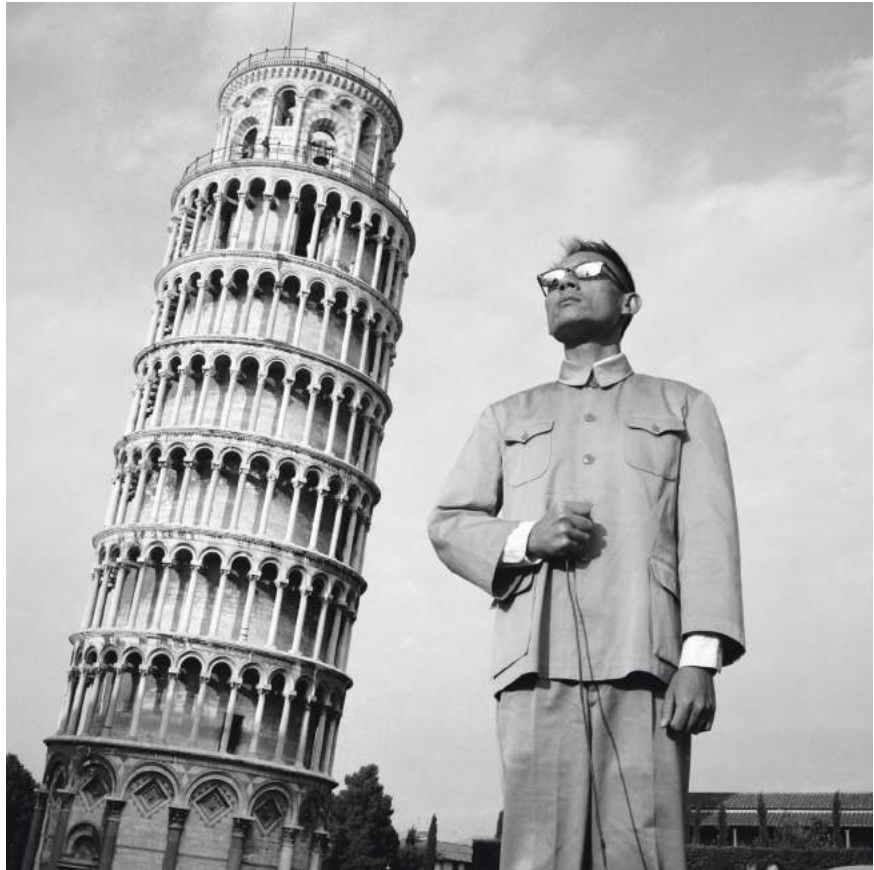
Pisa, Italy, 1989. East Meets West Self-Portrait Series 1979-1989, Tseng Kwong Chi.