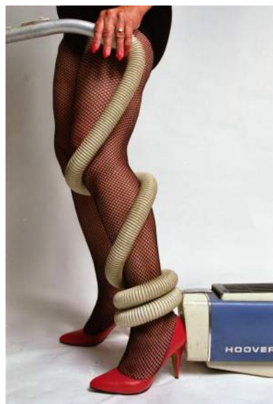
Libido Uprising, 1989. Joe Spence, Collaboration with Rosy Martin.