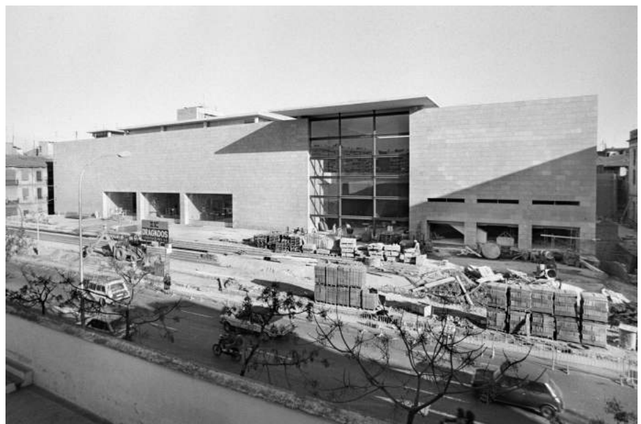
IVAM en obras , 1988.

1989 fue también el año en el que se inauguró el IVAM. La exposición 1989. IVAM , dentro de la línea de exposiciones Caso de estudio , ha partido de la propia colección del museo y de la